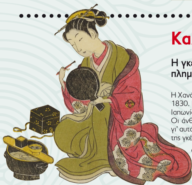
Suzuki Harunobu, Καλλονές στη συνοικία των απολαύσεων, έγχρωμο εικονογραφημένο βιβλίο, 1770. Συλλογή Μουσείου Ασιατικής Τέχνης Κέρκυρας

• Βρες στον χάρτη την πατρίδα της γκέισας.